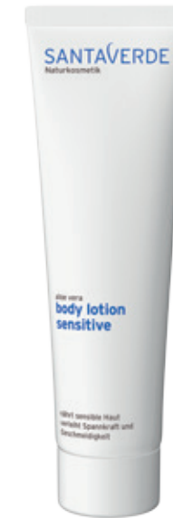
body lotion sensitive