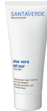
aloe vera gel pur ohne Duft