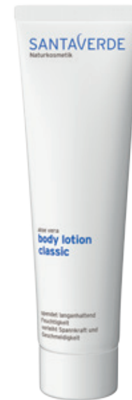
body lotion classic