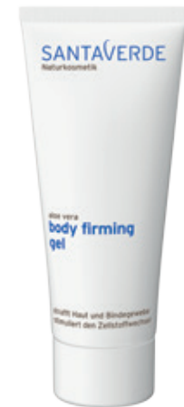
body firming gel